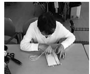
段ボール編みで小物作り