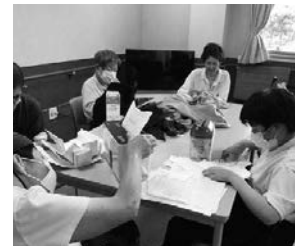
雑紙の断裁・ウエス作り