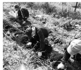
さつまいもの収穫

生産活動を通じ、役割を担うことでやりがいや生きがいに繋げることを目的にした活動班です。野菜を育てたり、敷地内の花壇の整備や草取りなどを行う農耕部門のグループと編み物など手工芸で自主生産品の制作を行う手工芸部門があります。活動の時間を仕事の時間として意識して取り組んでいます。