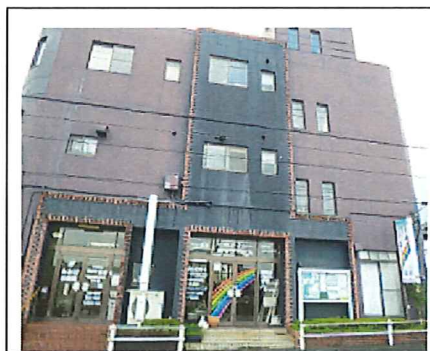
萩原の本社、居宅介護事務所

・障害福祉サービスの利用料は、厚生労働大臣が定める基準により算定した費用の額となります。その額から利用者負担を算出します。